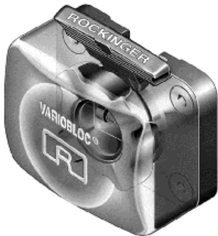
Basisplatte plaque de base piastra di base